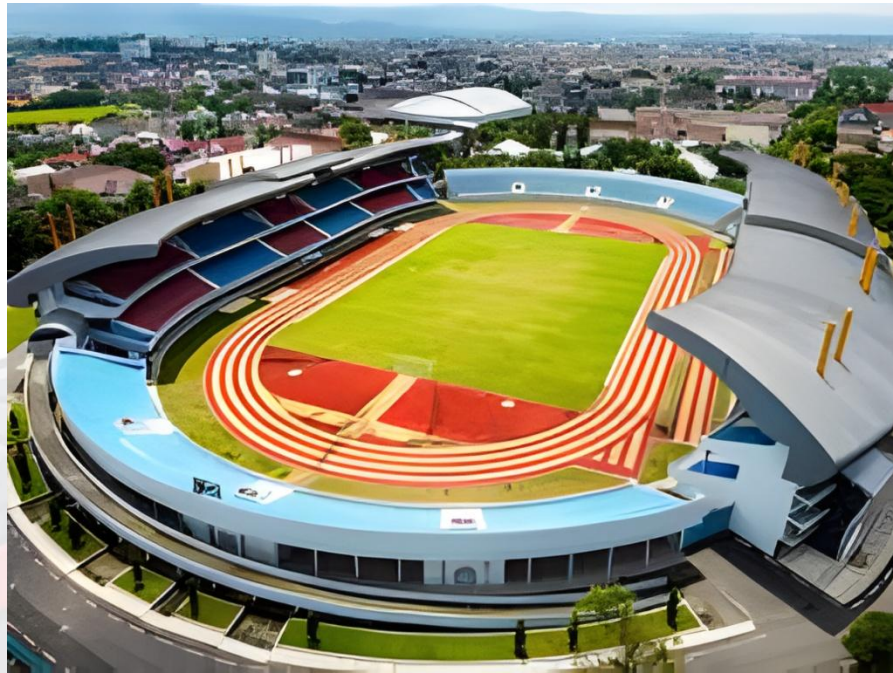
STADION MANDALA KRIDA, YOGYAKARTA