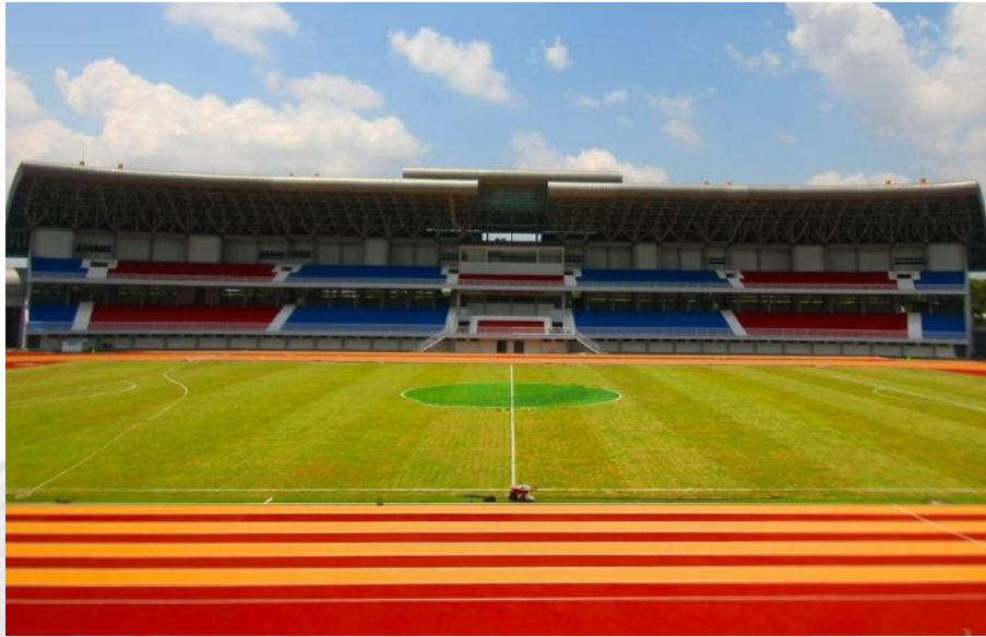
STADION MANDALA KRIDA YOGYAKARTA