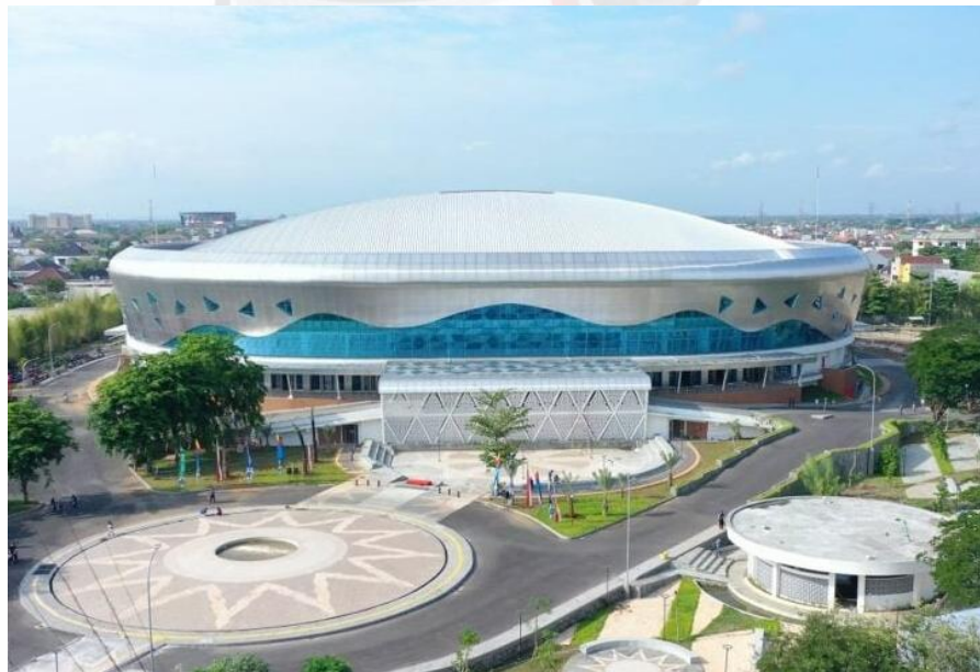
EDUTORIUM K.H AHMAD DAHLAN UMS