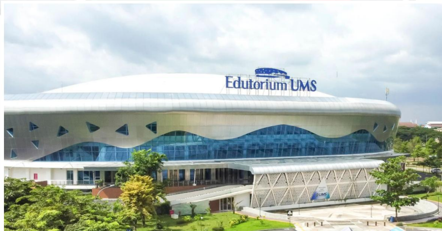
EDUTORIUM K.H AHMAD DAHLAN UMS