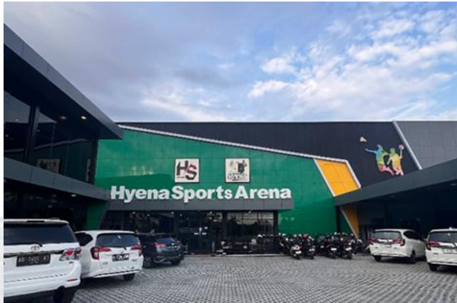
HYENA SPORTS AREA