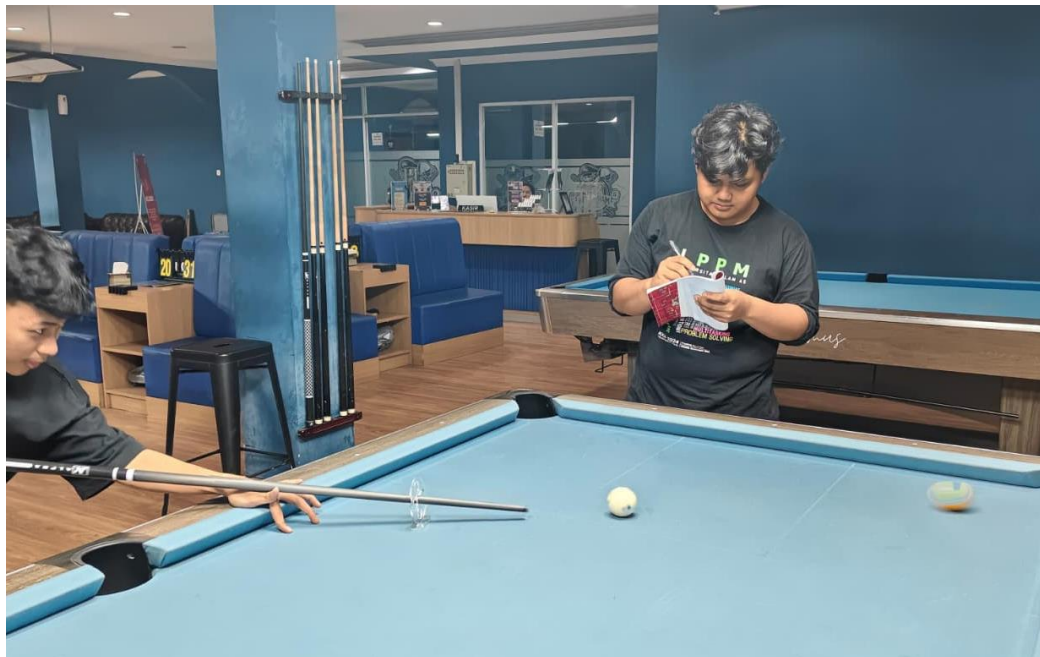
Penilaian dari post test dengan melakukan straight shot