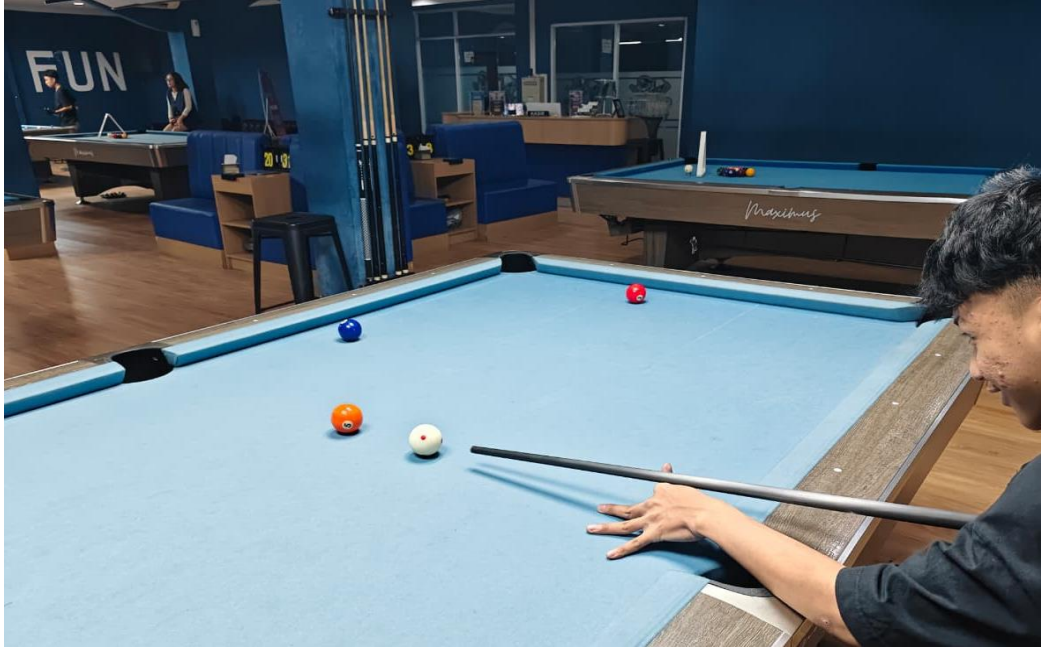
Pretest dengan melakukan straight shot