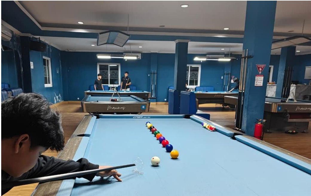
Treatment dengan melakukan line up drill