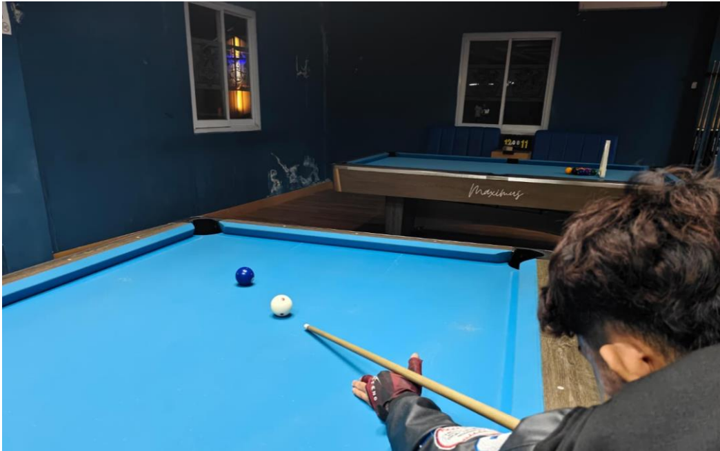
Post test dengan melakukan straight shot