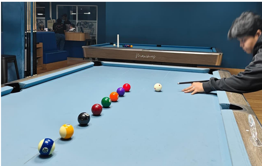
Treatment dengan melakukan line up drill