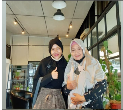
Lampiran 4 Foto Bersama Istri Penulis