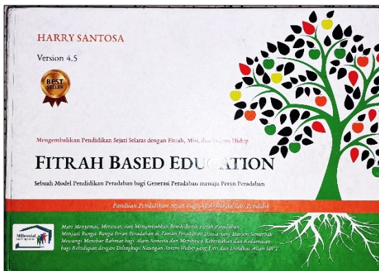
Lampiran 5 1 Sampul Depan Buku FBE