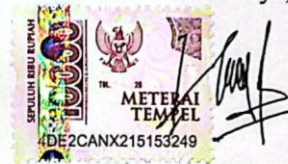
Muhammad Imam Al Farabi