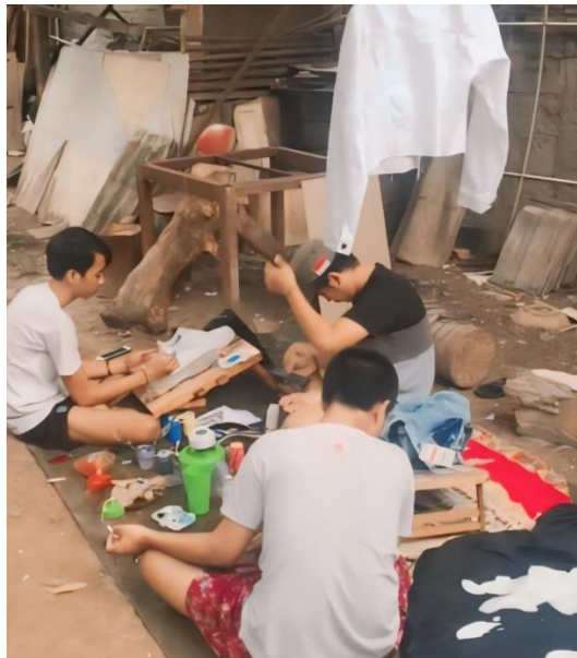
Gambar 1.2 Gambar proses restorasi pakaian

yang jelas dan mengenali target audiens yang ingin dijangkau. Selain itu, memanfaatkan berbagai fitur Instagram seperti hashtag dan story menjadi langkah strategis yang tidak boleh dilewatkan. Dengan pendekatan yang tepat, bisnis dapat memperluas jangkauan serta meningkatkan interaksi dengan konsumen, sambil membangun kepercayaan yang kuat terhadap merek. Kemudahan penggunaan fitur Instagram memungkinkan WHD ART untuk mempromosikan jasa seni lukis dengan cara yang menarik dan efektif. Penggunaan hashtag yang relevan juga dapat meningkatkan visibilitas konten, membantu menjangkau audiens yang lebih luas.