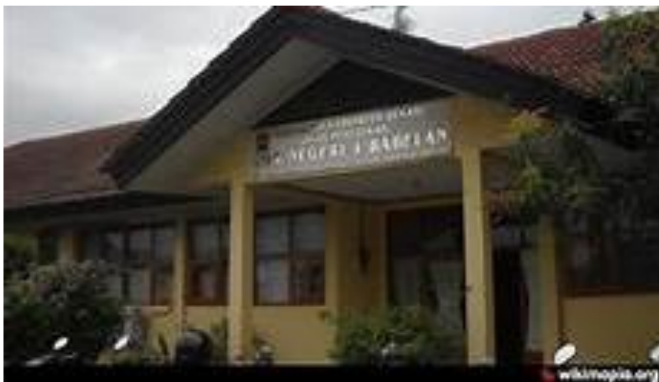
Gambar 1. 2 Sekolah SMAN 1 Babelan

Situasi ini juga terlihat dalam pembelajaran di SMAN 1 Babelan, di mana terdapat ketidakseimbangan dalam akses terhadap materi pendidikan seksual berbasis Islam dalam mata pelajaran Pendidikan Agama Islam. Berdasarkan pengamatan awal, sebagian siswa telah menerima materi tersebut melalui pembelajaran di kelas maupun kegiatan keagamaan di luar kelas. Sementara itu, sebagian lainnya belum pernah mendapatkan materi tersebut secara formal, yang berdampak pada perbedaan pemahaman dan sikap mereka terhadap isu seksualitas dan pergaulan remaja. Ketimpangan ini menimbulkan pertanyaan penting mengenai efektivitas penyampaian materi serta sejauh mana pendidikan seksual dalam kerangka Pendidikan Agama Islam mampu membentuk sikap asertif siswa dalam menghadapi tantangan sosial di lingkungan mereka