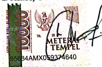
Fitri Nur Raihana