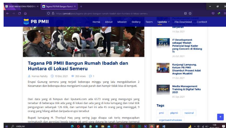
Gambar 1. 2. Contoh berita dalam website pmii.id

Selain temuan di atas ada beberapa berita dalam website pmii.id yang masih kurang lengkap yakni baik 5W+1H. Sebuah berita memiliki nilai dan unsur berita sudah menjadi acuan oleh seorang profesional jurnalis dan media.