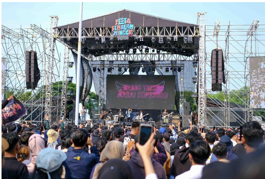
Lampiran Gambar 8 Event Pesta Semalam Minggu Pesta Lagi!! Bekasi