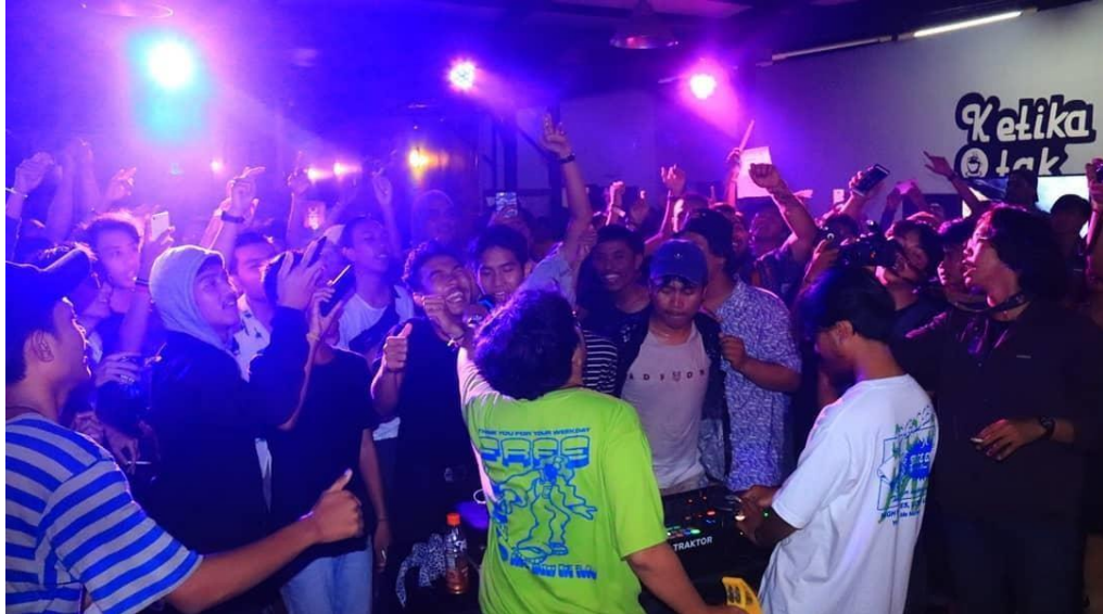
Lampiran Gambar 1 Event Pesta Semalam Minggu Vol.1