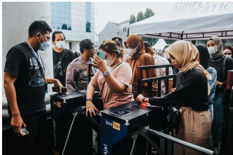
Lampiran Gambar 4 Event Pesta Semalam Minggu Pesta Lagi!!