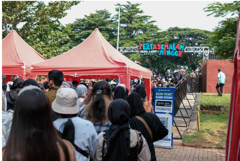
Lampiran Gambar 7 Event Pesta Semalam Minggu Pesta Lagi!! Bekasi