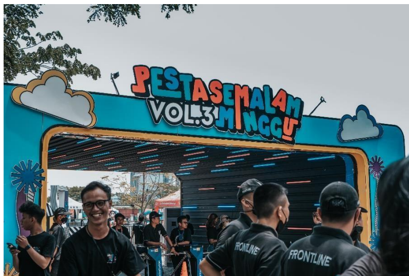
Lampiran Gambar 6 Event Pesta Semalam Minggu Vol.3