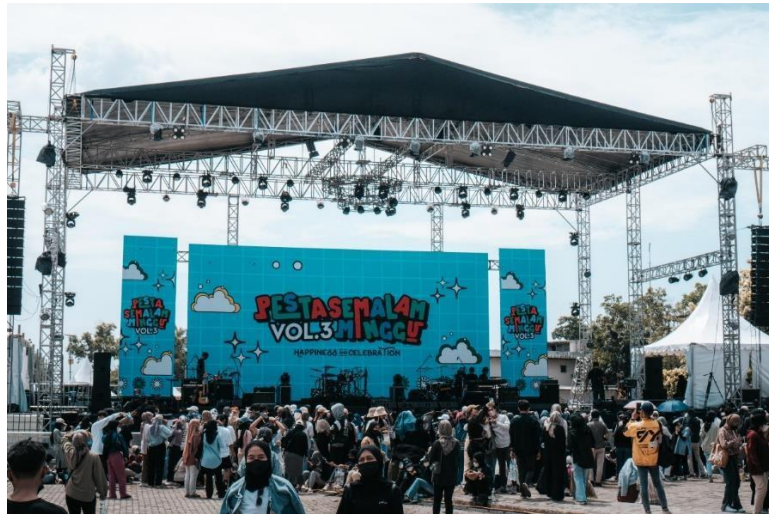
Lampiran Gambar 5 Event Pesta Semalam Minggu Vol.3