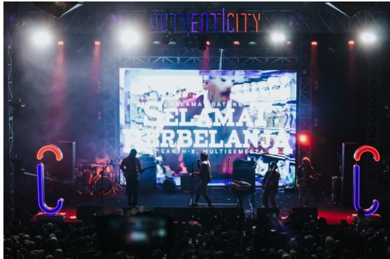
Lampiran Gambar 3 Event Pesta Semalam Minggu Pesta Lagi!!