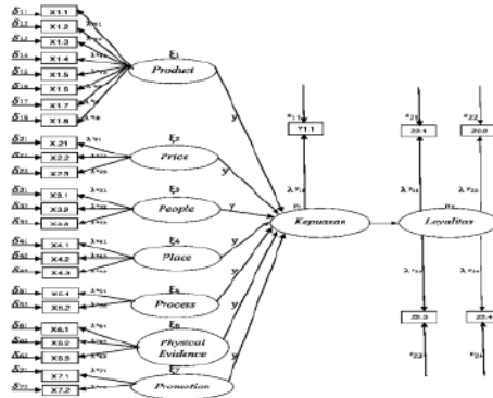
Gambar 1. Diagram Lintas Model

menjadi tujuan kuliner yang unggul jika dilakukan serangkaian pengembangan usaha. Jenis penarikan sampel menerapkan convenience sampling yaitu adanya screening terlebih dahulu yaitu konsumen yang yang berkunjung 19 h dari satu kali. Sumber data dalam penelitian ini menggunakan data primer dan sekunder. Data primer kuantitatif berasal dari kuesioner responden dengan kriteria pelanggan Rumah Makan Pondok Gabus Lukman yang sudah mengunjungi lebih dari sekali. Adapun data sekunder berasal dari studi literatur, jurnal, buku, data statistic, media massa dan lainnya yang mendukung hasil penelitian. Adapun kerangka kerja variabel operasional yang digunakan dalam penelitian ini terlihat pada gambar 1.