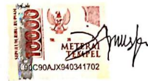
Riska Lutfi Yuniyasih