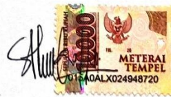
Salma Nabila Putri

Bekasi, 13 Februari 2024 Yang Membuat Pernyataan