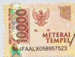
SATRIA AGIL MUNAWAR ARRAZY