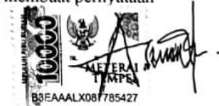
Anti Tri Octaviani