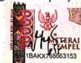
Diyah Ayu Pitaloka

Bekasi, 22 November 2023 Yang membuat pernyataan