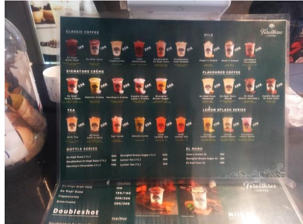
Daftar Menu non-Kopi Foresthree Coffee