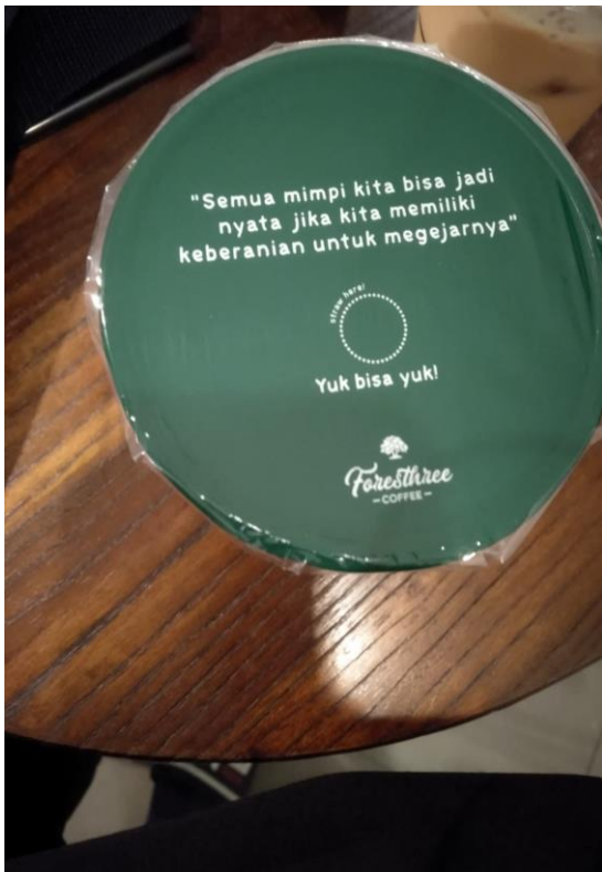
Contoh 2, Pertanyaan pada kemasan