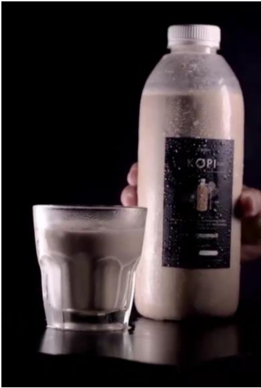
Menu Ukuran 1 Liter Konsumen