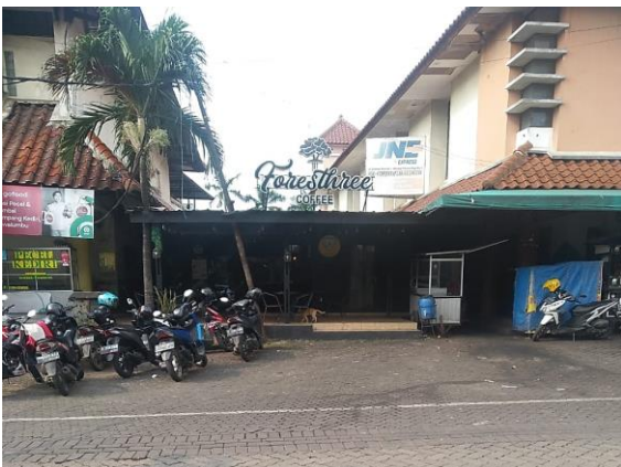
Tampak Depan Forestthree Coffee