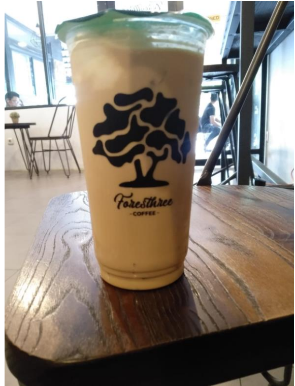
Menu Kopi Ukuran XL