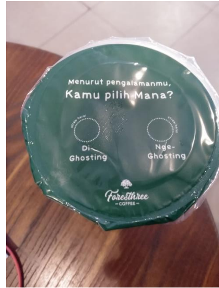
Contoh 1, pertanyaan pada kemasan