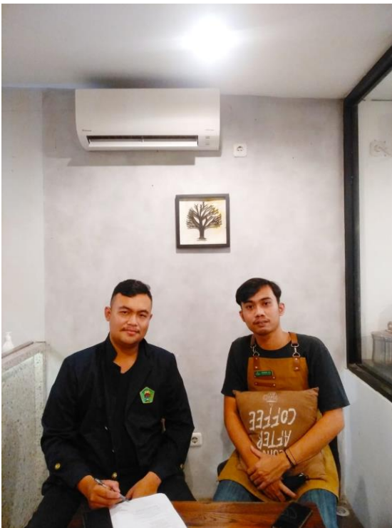
Wawancara dengan Manager/Head Bar Foresthree Coffee