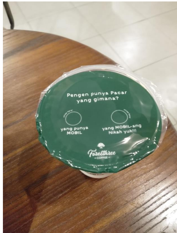
Contoh 3, Quotes pada