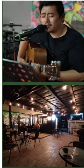
Area No Smoking & Mini Panggung Live Musik