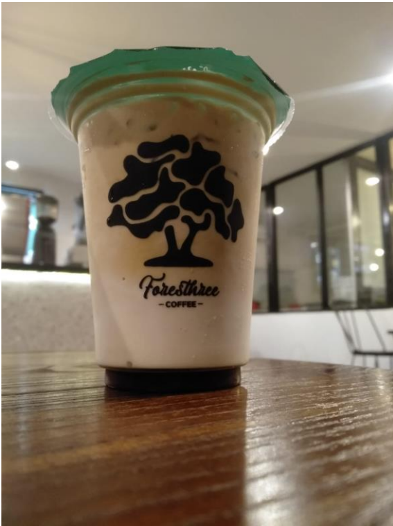
Menu Kopi Ukuran Normal