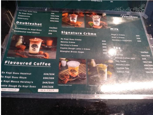
Daftar Menu Kopi Forestthree Coffee