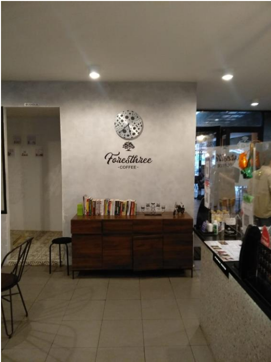
Logo Foresthree Coffee