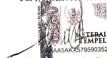
Fauzan Syariful Taufiq