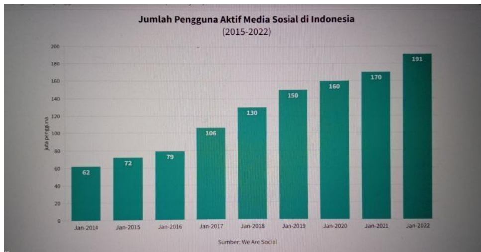
Gambar 1.1 Jumlah Pengguna Aktif Sosial Media Di Indonesia (tahun 2014-2022)

Analisis Sk Ios menunjukkan bahwa jumlah pengguna media sosial di Indonesia akan tumbuh sebesar 21 juta (+12,6%) di tahun 2022. Per awal 2022, Youtube memiliki 139 juta pengguna di Indonesia. Angka tersebut menunjukkan iklan instagram mencapai 35,7% dari total penduduk Indonesia pada awal tahun 2022. Namun, instagram membatasi penggunaan platform tersebut untuk orang yang berusia di atas 13 tahun, sehingga pada tahun 2022, 45,8% audiens indonesia yang "memenuhi syarat" akan menggunakan Instagram ( We Are Social, 2022 )