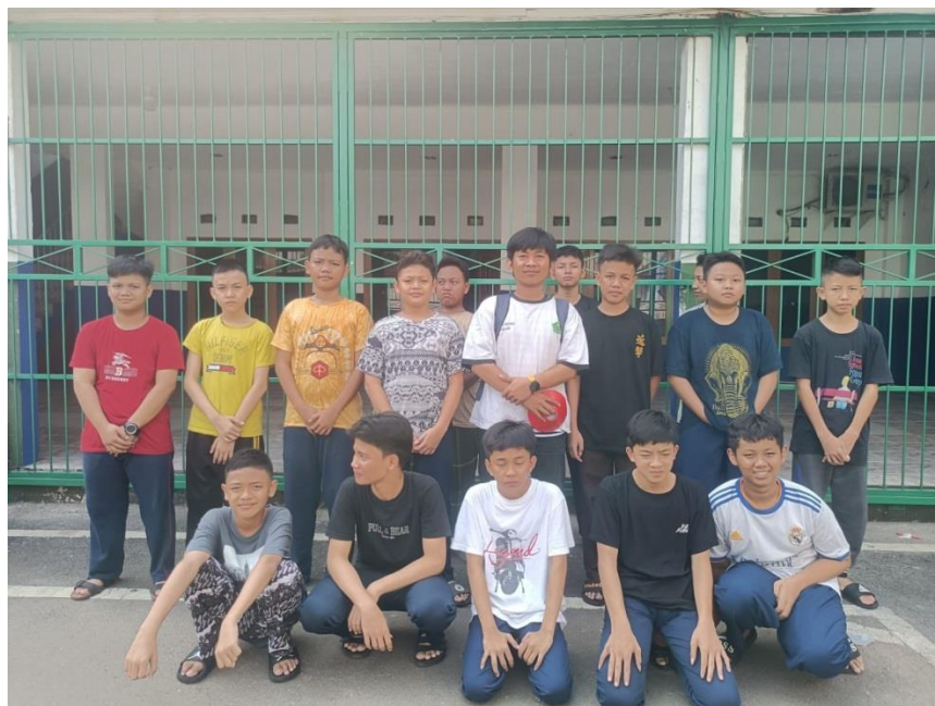
Foto Bersama Siswa Kelas VII SMP IT Al-Qur'aniyyah