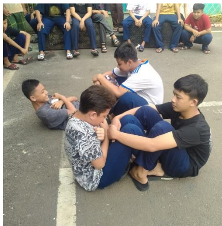
Tes Kekuatan Otot Perut