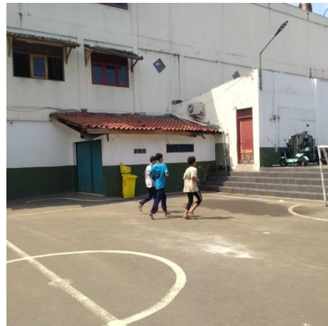
Tes Daya Tahan