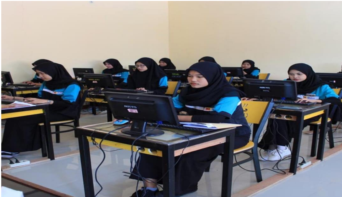
Ruang Kelas SMK Al-Bahri Bekasi