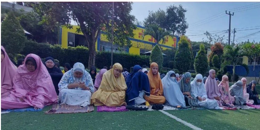
Sholat Dhuha Berjama'ah