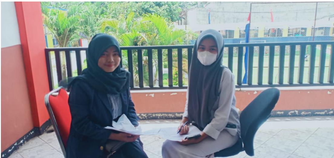
Wawancara dengan salah satu murid kelas XII MM (Multimedia)