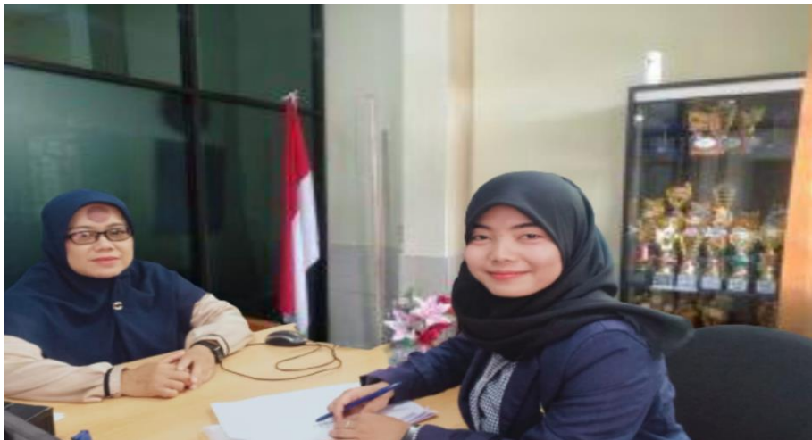
Foto dengan Kepala Sekolah SMK Al-Bahri Bekasi