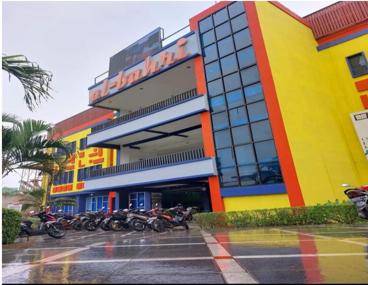
Sekolah SMK Al-Bahri Bekasi