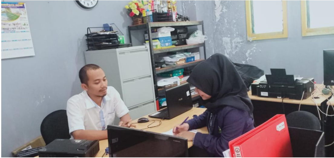
Foto Dengan Guru Pendidikan Agama Islam