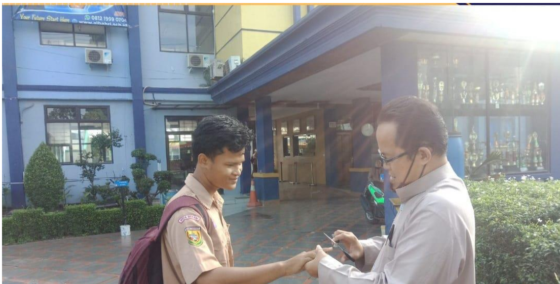
Pemeriksaan Kuku secara Rutin