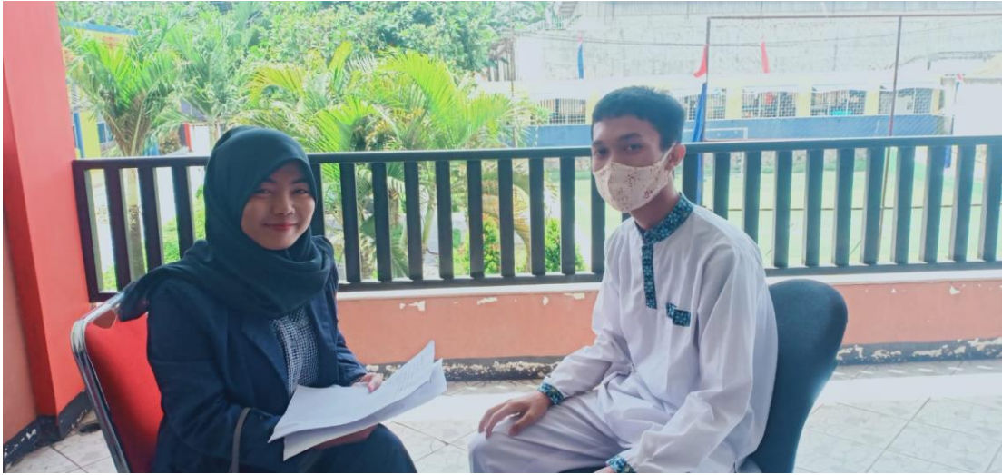
Wawancara dengan Salah Satu Murid kelas XI RPL (Rekayasa Perangkat Lunak)