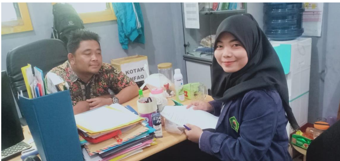
Foto Dengan Waka Kesiswaan