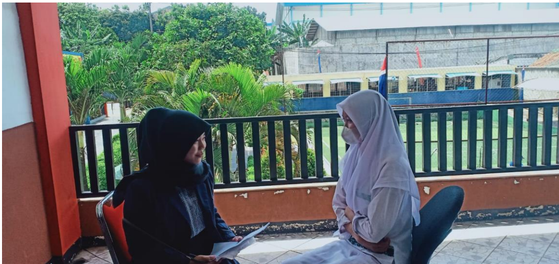
Wawancara dengan Salah Satu Murid kelas X TKJ (Teknik Komputer Jaringan)