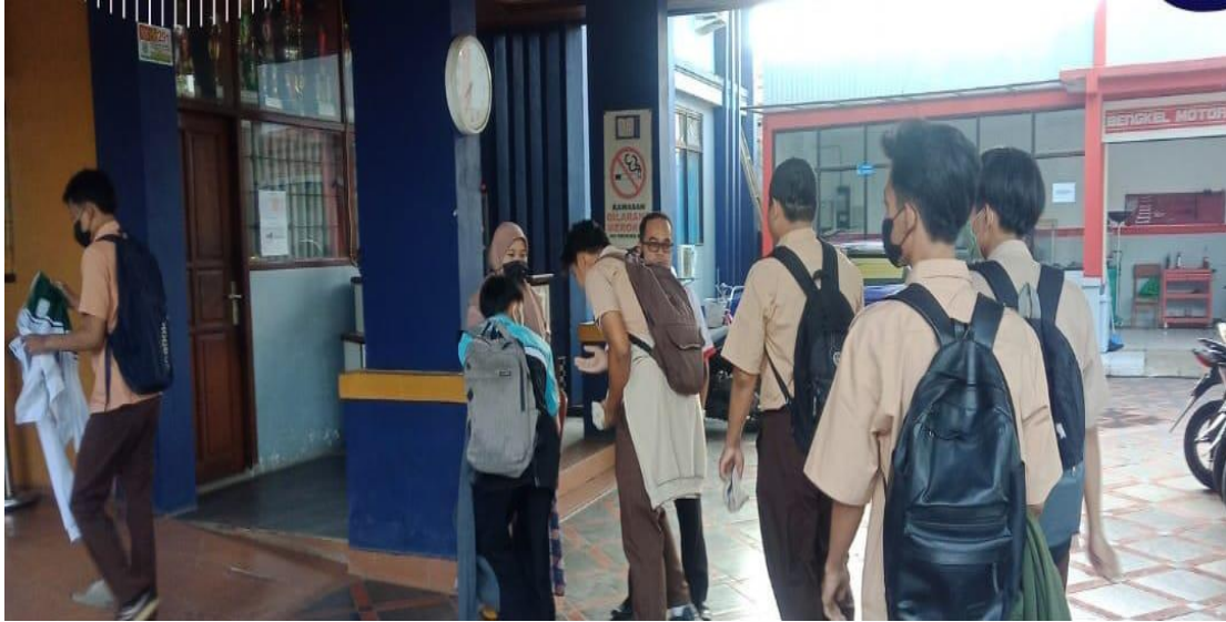
Bersalaman sebelum masuk kelas