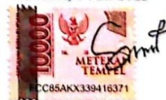
Soni Setiawan Pangestu