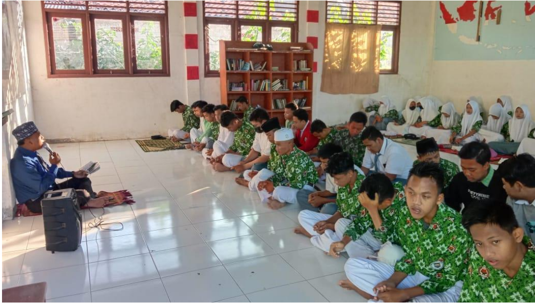
Kegiatan pembelajaran Al-Qur'an