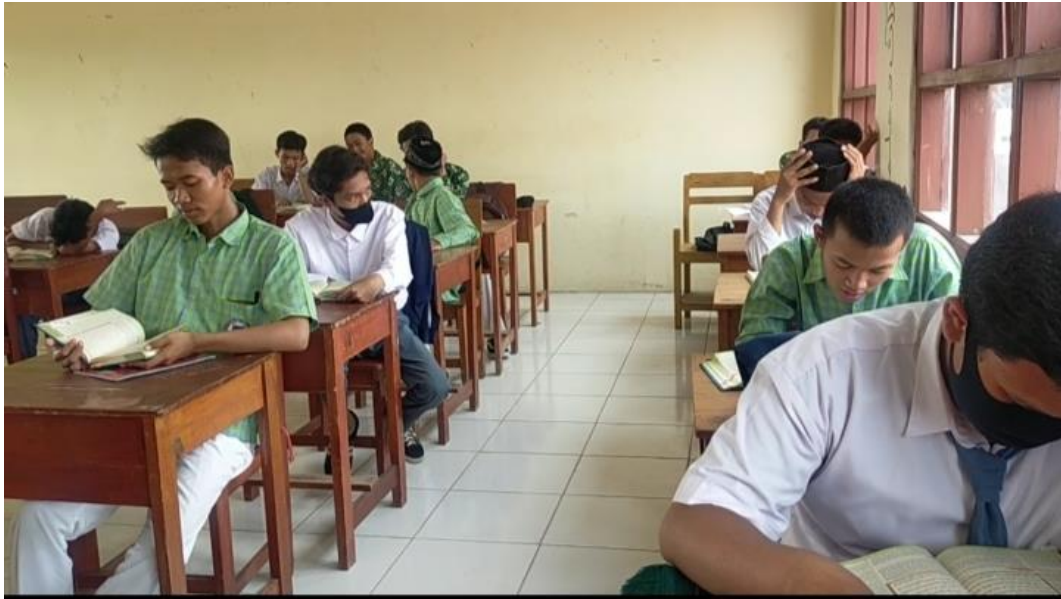
Evaluasi Pembelajaran Al-Qur'an