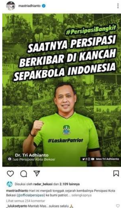
Gambar 1.3 Salah satu postingan pada akun @Mastriadhianto