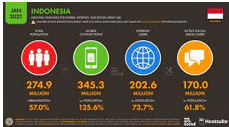
Gambar 2 Penguasaan media sosial di Indonesia

sekitar 6,3%. Pengguna internet di Indonesia meningkat sebesar 27 juta atau 15,5% menjadi 202,6 juta selama periode waktu yang sama.