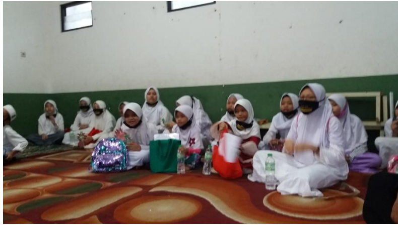
Wawancara dengan Ketua Dai Muda Cordofa