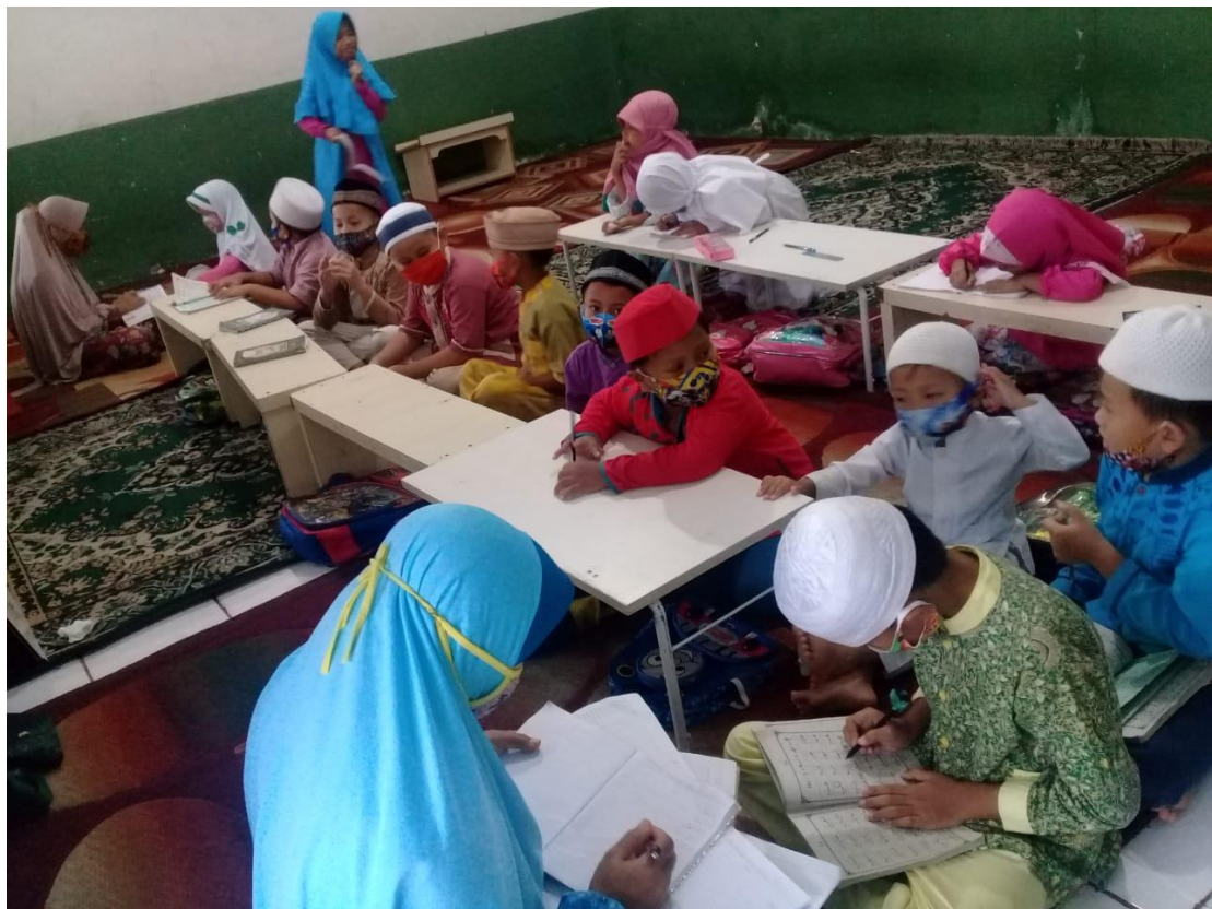
Kegiatan Praktek ibadah