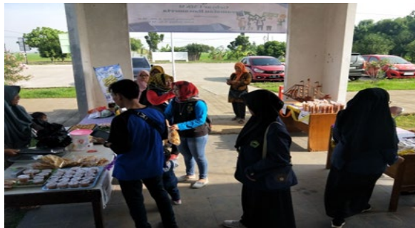
Gambar 1. Observasi Pedagang

Penulisan gambar ditampilkan dengan format posisi gambar diatas nama gambar dengan keterangan nama berjenis font Verdana ukuran 11 sebagaimana contoh