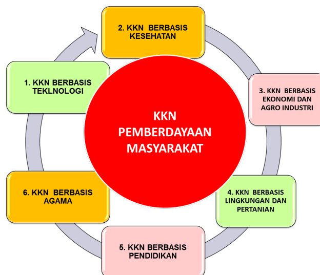
Gambar 1. Kegiatan KKN Berbasis Pemberdayaan Masyarakat

Tema KKN UNISMA Bekasi secara general adalah pemberdayaan masyarakat berbasis potensi lokal yang didasarkan pada tiga pilar utama, yaitu perguruan tinggi, dunia usaha/industri, dan pemerintah daerah. Adapun basis pemberdayaan masyarakat sebagaimana gambar berikut: