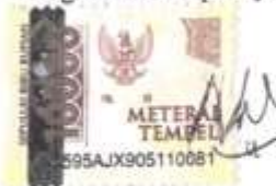
Naufal Azhara Haq

Bekasi, 13 Februari 2022 Yang membuat pernyataan,