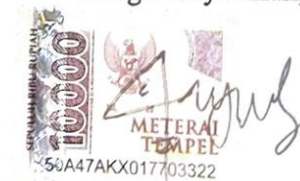
Ayu Citra Ningrum